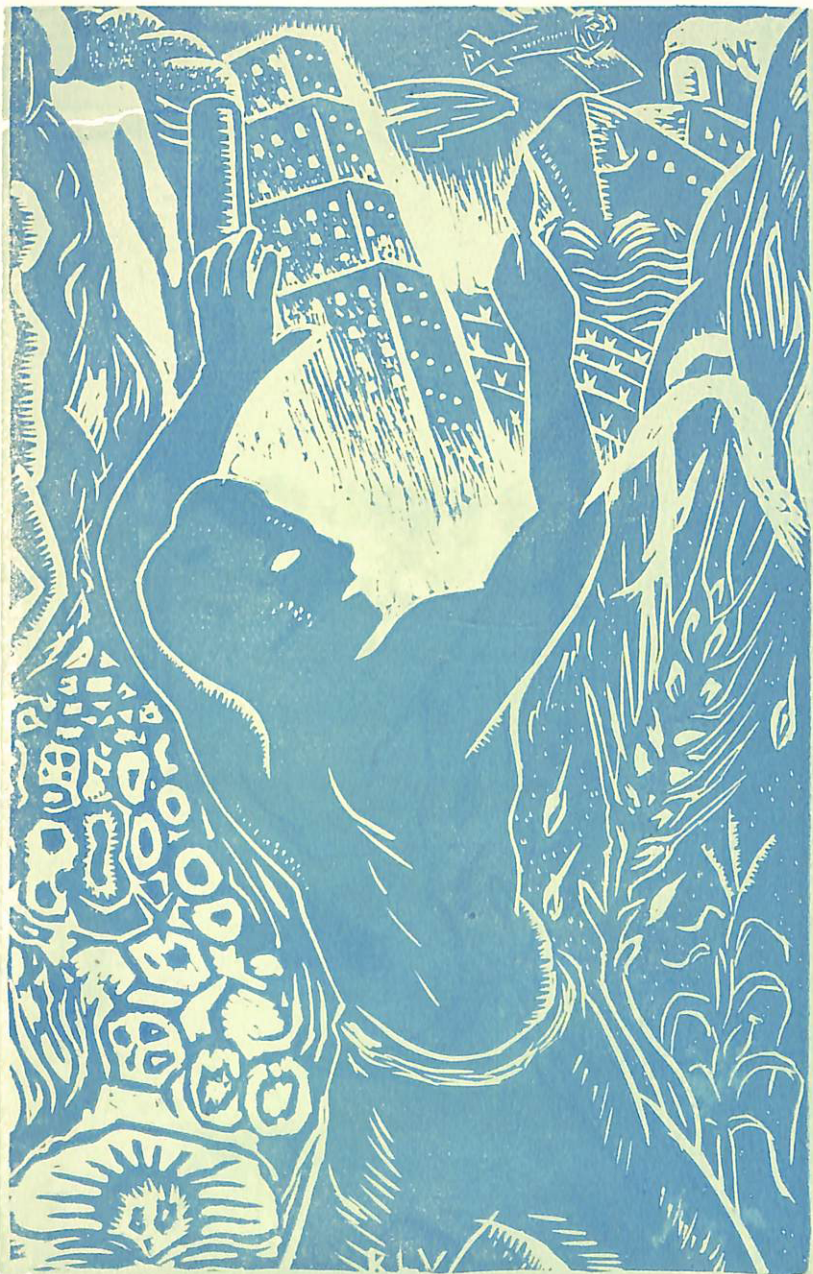
GRABADO POR: RAFAEL LOPEZ VAZQUEZ