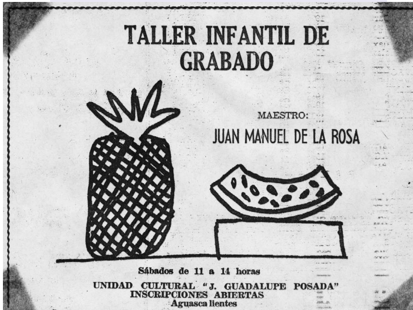
Anuncio publicado en el Sol del Centro , 16 de febrero de 1973.

El impulso que tuvo el grabado desde ese entonces llevó al Instituto Cultural de Aguascalientes, décadas más tarde, a realizar desde 1993 hasta 2011 el Concurso Nacional de Grabado José Guadalupe Posada, que pasó a ser en 2013 la Bienal Internacional de Estampa José Guadalupe Posada, añadiéndose también en 2017 el Concurso de Estampa Ex Libris.