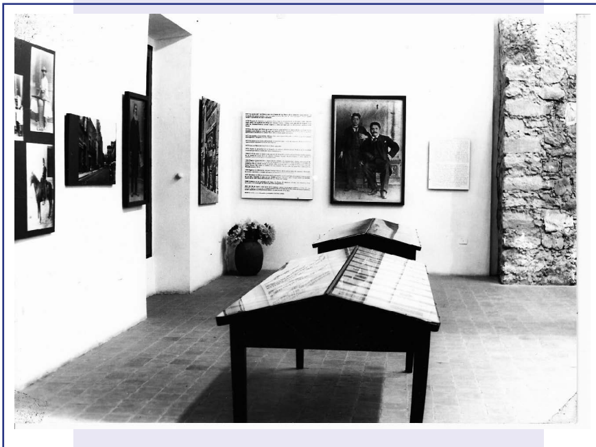
Sala de exhibición, 1972.

La Unidad Cultural contó con dos salas de exhibición dedicadas a la vida y obra de José Guadalupe Posada, artista que a través de su gráfica dejó ver aspectos sociales cotidianos de México a finales del siglo XIX. Los grabados originales que conformaron el acervo fueron proporcionados por el Instituto Nacional de Bellas Artes. Además, pronto la finca fue utilizada para diversos eventos artísticos, como temporadas de conciertos de la Orquesta de Cámara de Aguascalientes y el Coro del Instituto Aguascalentense de Bellas Artes.