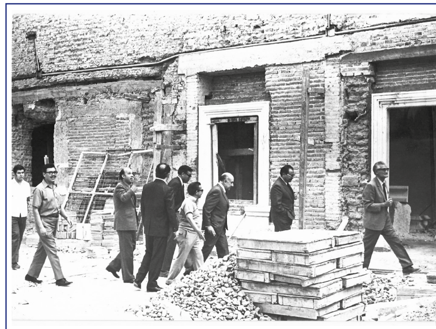
Recorrido por la finca en proceso de remodelación, ca. 1972.

A unos días del 52 aniversario del primer museo de arte en el estado de Aguascalientes, resulta necesario hablar un poco sobre su inicio. La historia del Museo José Guadalupe Posada, además de la obra del grabador que conserva, adquiere relevancia hasta nuestros días.