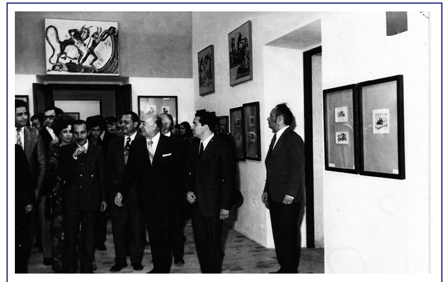
Recorrido inaugural de la Unidad Cultural, 1972.

Así pues, a inicios de la década de los 70, fue comisionado el arquitecto Francisco Aguayo para el proyecto de convertir la antigua finca que se encontraba al costado del Templo del Señor del Encino en el nuevo museo y unidad cultural. Dicho sitio había servido en un inicio como casa cural del templo y, posteriormente, como oficinas de la Junta Local de Caminos. Sin embargo, gran parte del siglo xx estuvo en estado de abandono. Luego de su remodelación, la Unidad Cultural José Guadalupe Posada fue inaugurada el 16 de septiembre de 1972 por el gobernador del Estado Francisco Guel Jiménez y un representante del presidente Luis Echeverría; así mismo, se designó como directora del Museo a Ofelia Delgadillo.